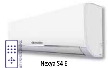
Nexya S4 E